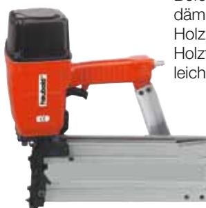
Breitrücken- Klammergerät PN 29130 D

Befestigung von Wärmedämmverbundsystemen auf Holzunterkonstruktionen, Holzfaserverplatten, Holzwoolleichtbauplatten