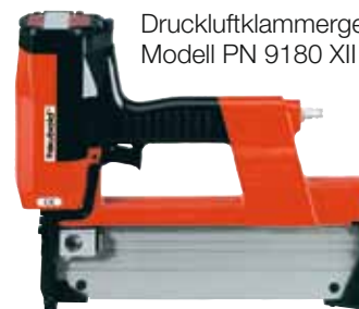
Druckluftklammergerät Modell PN 9180 XII Kontakt